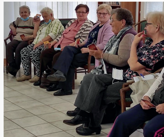
Az első szakmai műhely az idősekkel

Problémaként említették az intézménybe való eljutás nehézségét a buszjárat vagy más helyi szállítószerelés hiánya miatt (az intézmény a település szélén helyez-