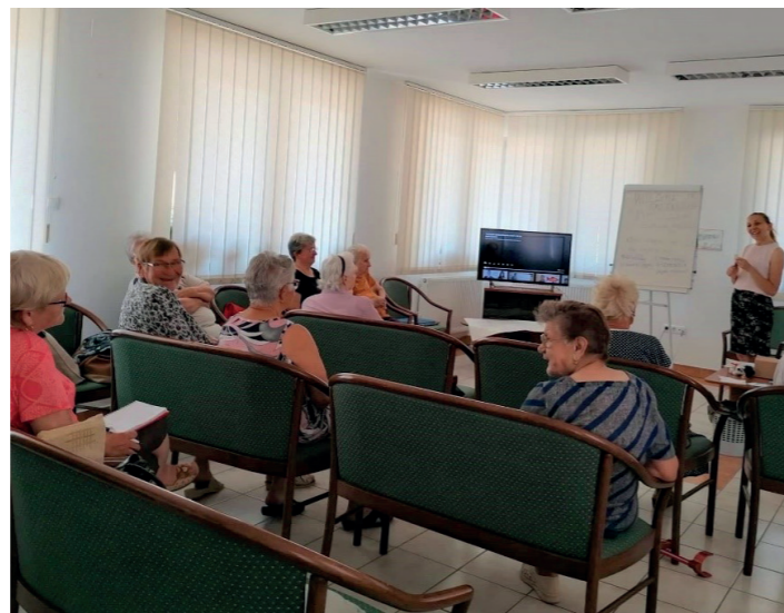
Angol nyelv oktatása a nappali klubban

Az esettanulmány, illetve cselekvési terv elkészítésével a projekt egyik szakasza lezárult, az elkövetkező időszakban a szolgáltatás közösségi módon történő mű-